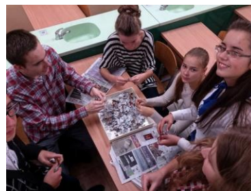
Popierius iš makulatūros

Lapkričio 11d. Nacionalinio projekto „Mes rūšiuojame“ vežėjams atidavėme 20kg baterijų ir galvaninių elementų, 15 kg dujošvyčių lempų, 164kg elektros ir elektroninių atliekų. Visuotinio švietimo savaitę pasitikome mokyklos energijos taupymo vidiniu auditu. Išsiaiškinome mokyklos energijos taupymo stipriąsias bei silpnąsias puses, kaip mokykloje taupyti popierių, vandenį, elektrą ir šilumą, sukūrėme atsakingos mokyklos principus.