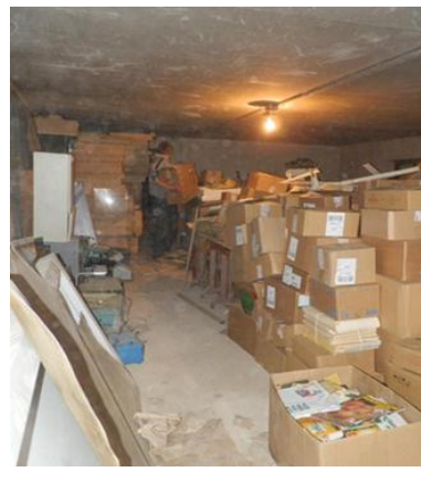
Mokyklos rūsiuose rūšiuojame makulatūrą