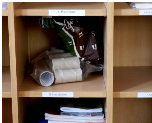
Tualetinio popieriaus ritinėlius dailės mokytojai paliekame lentynėleje