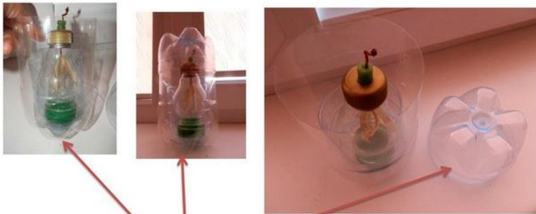
Elektrometro dėžutė iš plastikinio butelio

Iš saldainių popierėlių ( www.ekodaiktai.lt kūrėjams) daugiau kaip 100 gimnazijos moksleivių sukūrė virš šimto originalių kilimų. Nupynė 138m. ilgio kilimą (šeštą pagal ilgį Lietuvoje), kuriuo subūrė senosios gimnazijos bendruomenę vardan bendro kilnaus tikslo ir taip priminė opią šiukšlinimo problemą.